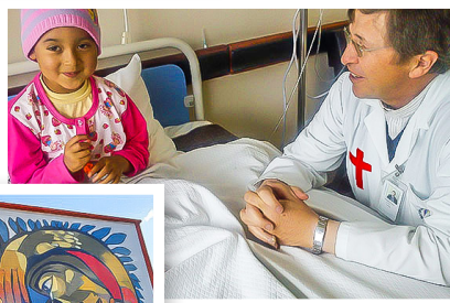
Hospice San Camilo en Quito (Ecuador)